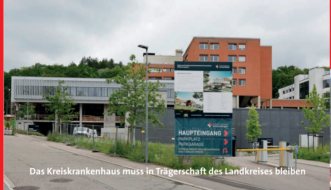
Das Kreiskrankenhaus muss in Trägerschaft des Landkreises bleiben

WAHLBERECHTIGTE Bei den Kreis-, Gemeinde- und Ortschaftsratswahlen sind alle wahlberechtigt, die die deutsche Staatsangehörigkeit oder die eines anderen Mitgliedsstaates der Europäischen Union haben, mindestens 16 Jahre alt sind und seit mindestens drei Monaten im Landkreis, in der Gemeinde bzw. der Ortschaft wohnen.